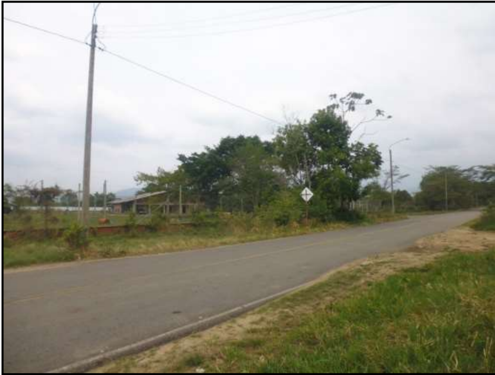
VÍA DE ACCESO: DIAGONAL 8VA – KM 1 VÍA ACEITE ALTO