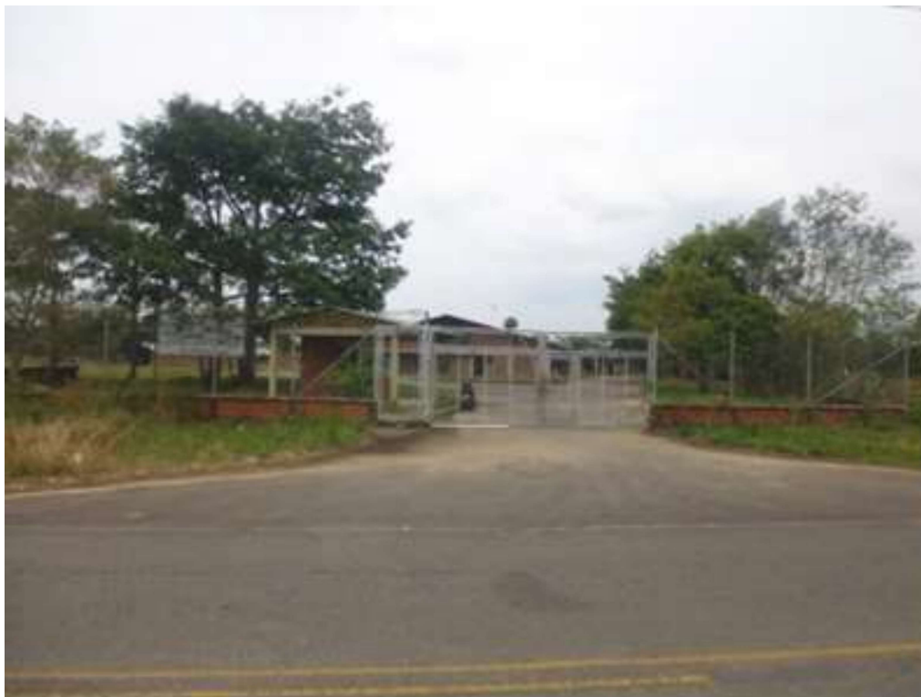
VISTA DEL ACCESO PRINCIPAL A LA PLANTA