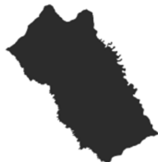
Puntaje de Yopal con el recálculo del ICC 2025

6.607.962 Valor agregado per cápita 2023 (millones COP)